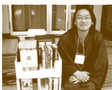
東京の「不忍ブックストリート」 (谷中・根津・千駄木)での 開催の様様。

「手のひらサイズ」から「両手で抱える大きさ」 まで、「一箱に入るだけ」をルールに古本を販売 するフリーマーケット方式の古本市です。販売ス ペースはこちらで用意します。ぜひみなさんの 個性的な「一箱」古本屋を出店してください。